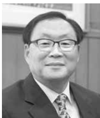
ソ ヨンジン 徐 榮振

1946年、神奈川県出身。 1972年、外務省入省。広報文化交流部長などを経て、ユネスコ日本政府代表部特命全権大使、駐デンマーク特命全権大使、2010年7月より2013年7月まで文化庁長官。 現在、近藤文化・外交研究所代表、外務省参与（国連安保理非常任理事国選挙担当大使）。